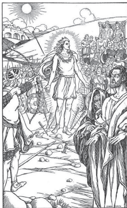
Fig. 4 · Balder el hermoso. Por Elmer Boyd Smith, 1902.

Existe un antiguo argumento victoriano de que el cristianismo es poco más que paganismo reciclado, y que sus mejores ideas simplemente fueron robadas y reformuladas. Después de todo, escribió más de un antropólogo emocionado, oliendo sangre: el antiguo Egipto, Grecia y Roma conocían los nacimientos virginales y los dioses que morían y resucitaban. Orfeo, descendiendo al Hades para rescatar a su novia; Baco, el dios nacido de mujer, honrado a través del vino; Osiris, el dios «resucitado»: ¿acaso no suenan todos familiares, demasiado similares, de hecho, a Jesús?