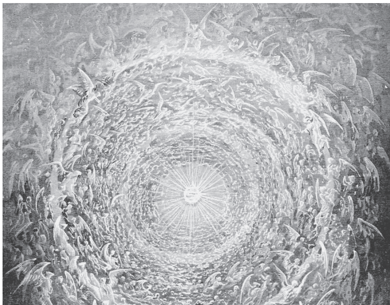
Fig. 3 · La Rosa Celestial, 1867. Ilustración de Gustave Doré de la visión de Dante al final de la Divina Comedia.

Y así, como el Verbo extrovertido de Dios, como el Hijo lleno del amor de Su Padre, Él se convirtió en la Lógica detrás de la creación, «el principio», el fundamento de todo, y aquel para quien todo sería (Col. 1:17-18). Luego, en el poder del Espíritu que se movía sobre las aguas, el Verbo salió. Dios habló, y a través de ese Verbo potente todas las cosas llegaron a existir. Como el Padre dijo del Hijo: «Tú, oh Señor, en el principio fundaste la tierra, y los cielos son obra de tus manos» (He. 1:10; citando el Sal. 102:25). El Hijo se convirtió de hecho en «el primogénito de toda creación» (Col. 1:15).