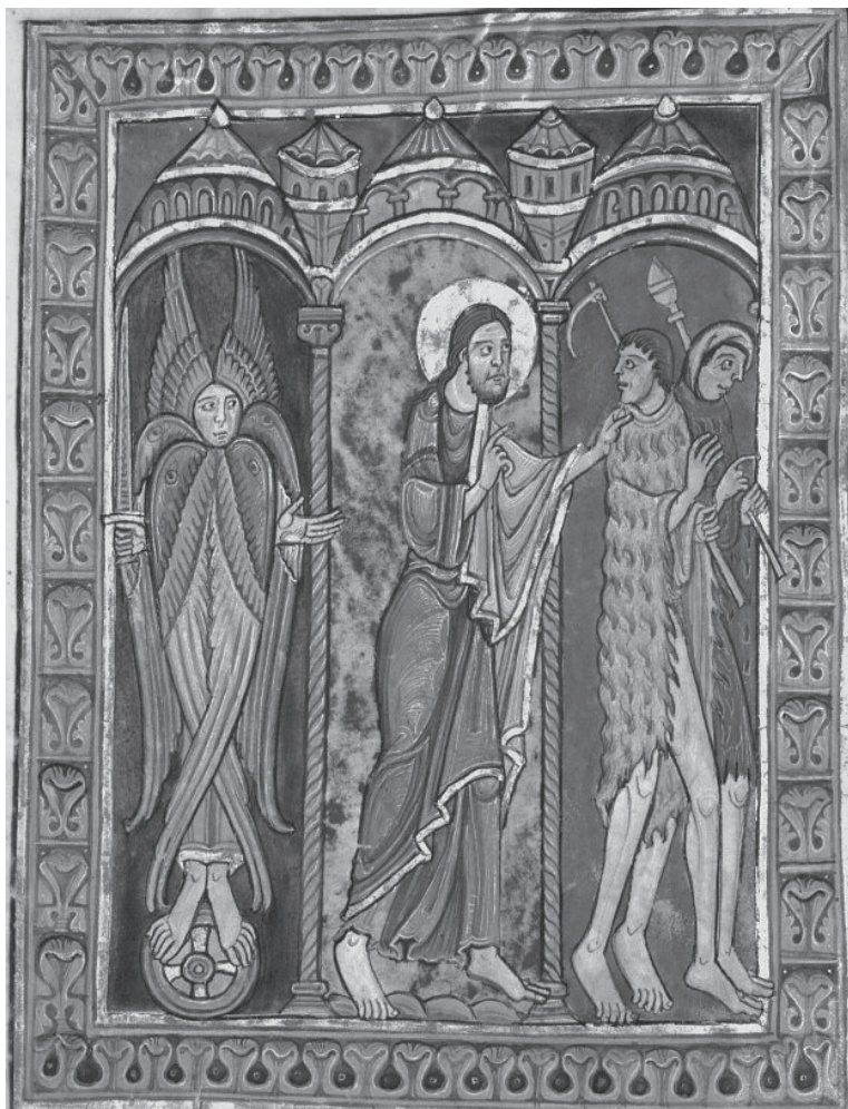
Fig. 6 · Cristo expulsa a Adán y Eva del Jardín del Edén. Salterio de San Albano, c. 1130.