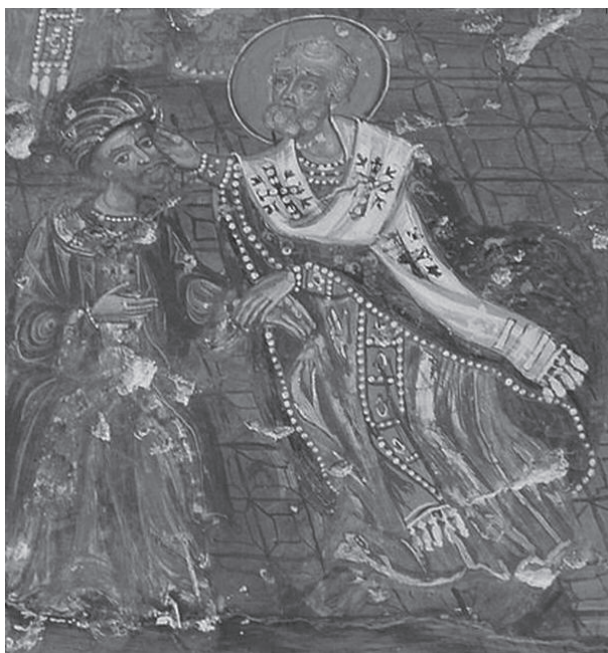
Fig. 2 · El legendario ponche navideño de San Nicolás el Taumaturgo.

La imagen. El heredero. El amado. Como lo expresó el teólogo del siglo IV, Atanasio: «El Hijo es el Todo del Padre».7